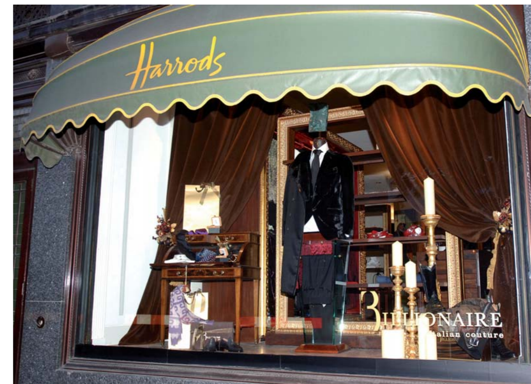
Harrods lässt bitten: Der Ägypter Mohammed Al Fayed, Besitzer des Nobelkaufhauses, ist nicht nur Briatore's Freund, sondern auch Fan der Billionaire Couture.