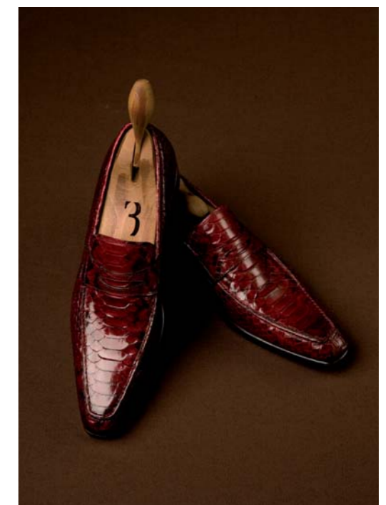
Mix and Match: Bevorzugt werden die Krokodier Loafers zu den Edel-Jeans kombiniert.

Kosten? Darüber spricht man nicht, denn der Mann von Welt weiß, dass eine Erstausrüstung schnell bei EUR 200.000,00 liegen kann. Realistische Preise, wenn man sich in das feine Jackett zu EUR 11.400,00 oder das Hemd zu EUR 890,00 verliebt. Beckham und Co sind bereits Stammkunden und wie man hört,