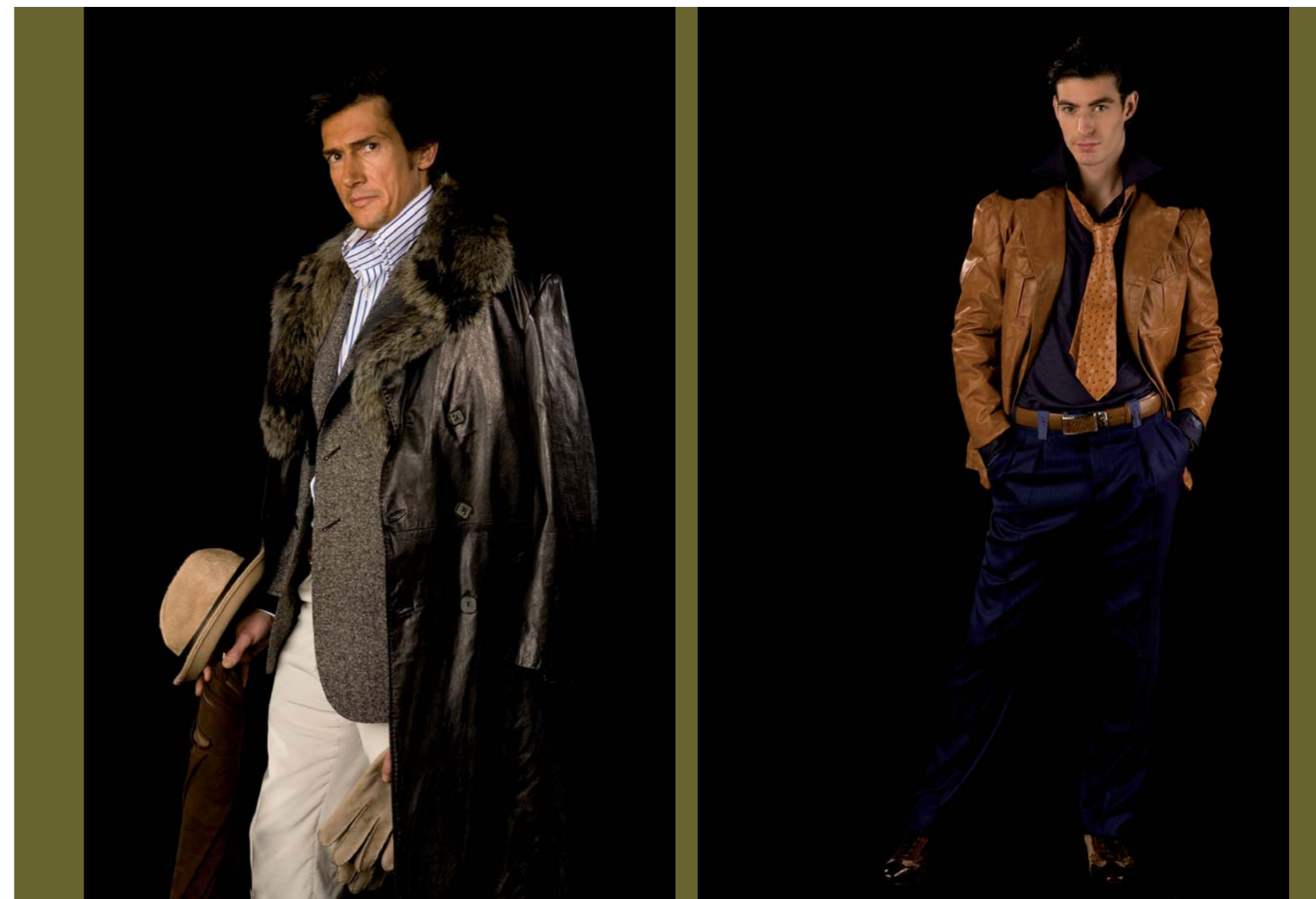
Gestylt von Kopf bis Fuß. Auch die Accessoires haben ihren Preis, z. B. der Hut für EUR 1050,00. Krawatte und Jackett aus Straußenleder, die Loafers als Blickfang mit Piratenkopf.