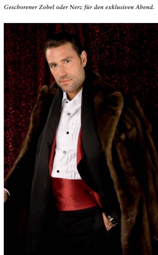
Geschorener Zobel oder Nerz für den exklusiven Abend.