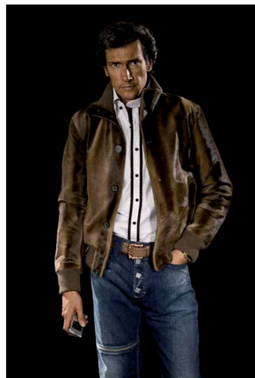
Italienischer Chic mit britischem Understatement. Der Gürtel des sportlichen Outfits ist aus Fischhaut.