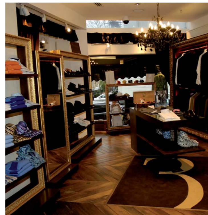
Billionaire Headquarter in der feinen Brompton Road in London.