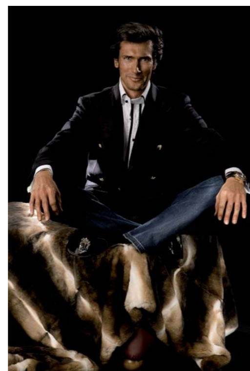
Zur Jeans mit echten Goldfäden oder echtem Silberdraht kombiniert man Blazer in Shantung-Seide. Die Knöpfe sind natürlich aus echtem Gold oder Silber.