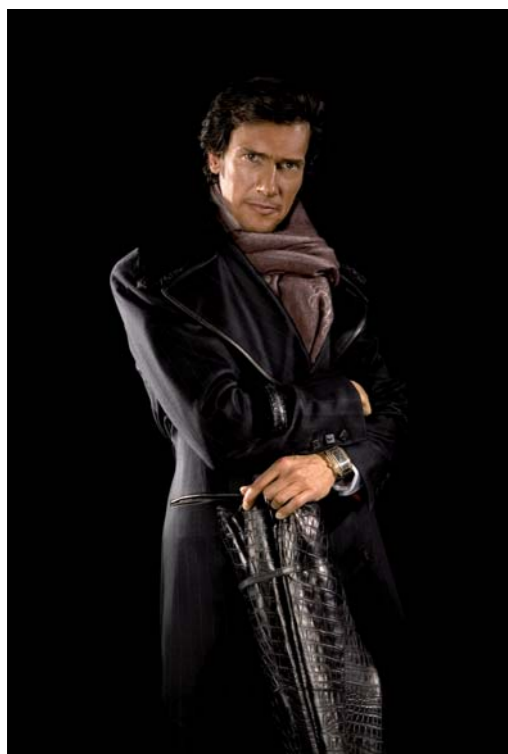
Mode auch alltagstauglich – das entsprechende Kleingeld vorausgesetzt.