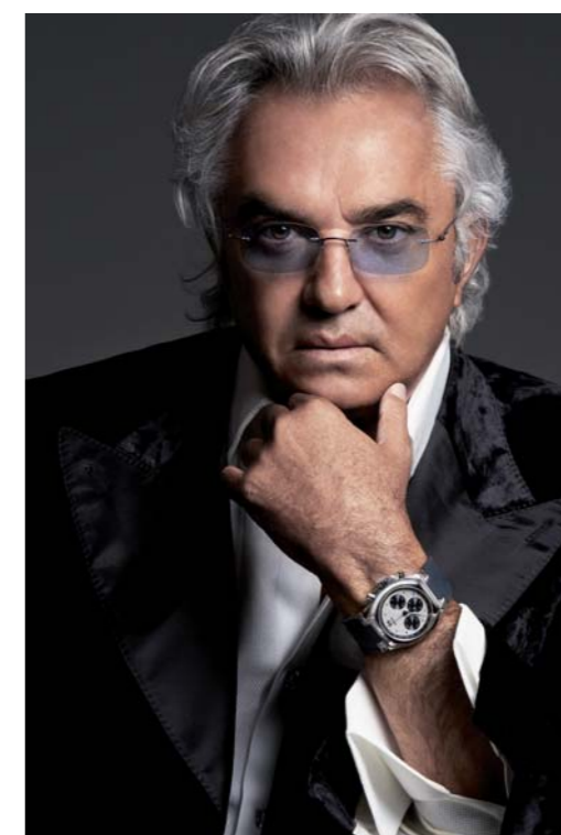
Renault-Rennstallchef Flavio Briatore will mit seiner Billionaire Couture auch nach Babrain, Dubai und Shanghai.

www.billionairecouture.com Flagshipstore: 154 Brompton Road, London sowie Harrods, London Yikai Li Boutique No 7, Wien 1 Billionaire Moscow Shop Vesna – Novy Arbat 19 - Moscow